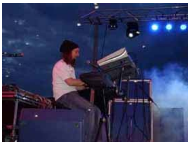
Actuación en el Concierto Homenaje a las Víctimas del Fascismo, Muelle de la Sal (Sevilla)