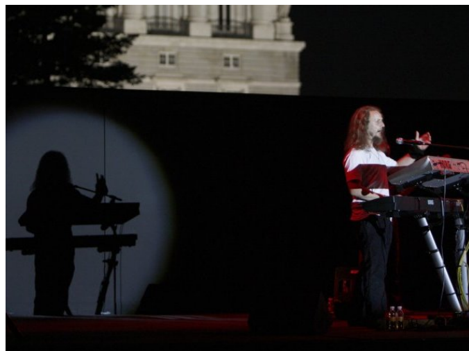
Actuación en los Veranos de la Villa 2007 – Jardines de Sabatini (Madrid)